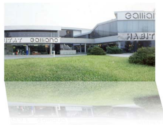
Esterno showroom di None

Nel 1962 nasce Galliano Habitat un'azienda che inizialmente propone uno stile tradizionale per poi concentrarsi sulla distribuzione di arredamento contemporaneo e di design in Italia, diventando il punto di riferimento per la progettazione di spazi abitativi all'avanguardia. L'esposizione di arredi, mobili e complementi per la casa si sviluppa sui due piani di un moderno edificio a None (TO), dove vengono realizzate aree di allestimento diversificate per tipologia di prodotto o per marchio.