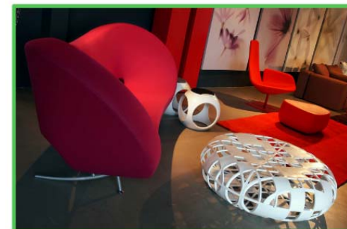
Allestimento degli anni duemila