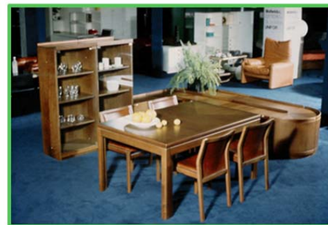
Allestimento degli anni '70

Il cambiamento del gusto e degli stili di vita determinano il costante ammodernamento della struttura, senza però alterarne l'impronta estetica che si è mantenuta sempre attuale col passare degli anni. Già alla fine degli anni sessanta espone i prodotti delle aziende di design più importanti; negli anni settanta è il primo showroom di interior design italiano ad adottare la formula del "cash and carry". Tra le numerose iniziative di Galliano Habitat non mancano inoltre diversi eventi e mostre in collaborazione con i principali partner e fornitori, tra i quali Artemide, B&B, Cassina, Driade, Kartell, Molteni, Moroso.